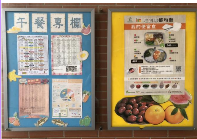
午餐專欄公布菜單及營養小常識等資訊