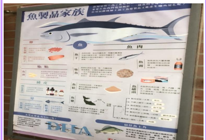
豐食良食圖譜大海報說明各食物家族